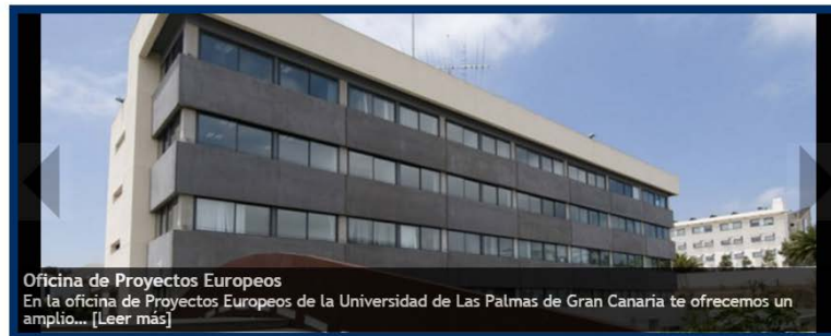
Oficina de Proyectos Europeos En la oficina de Proyectos Europeos de la Universidad de Las Palmas de Gran Canaria te ofrecemos un amplio... [Leer más]